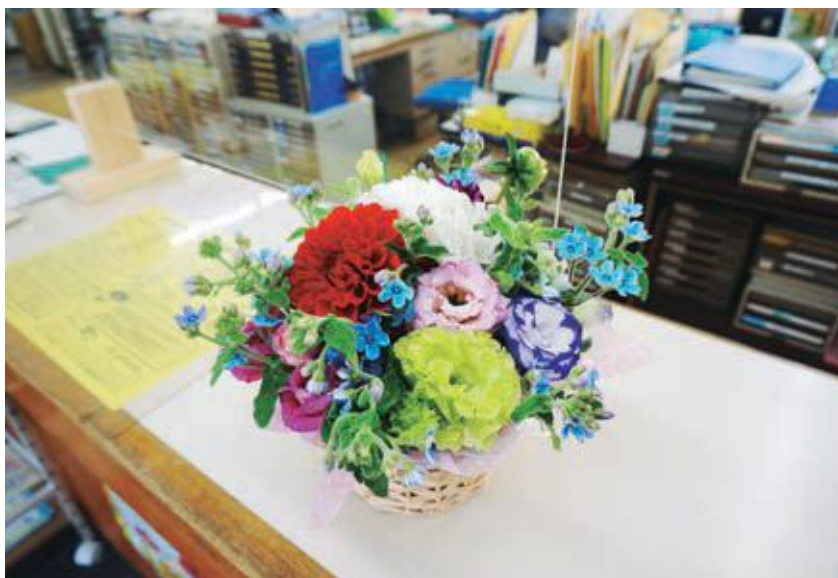
花卉農家支援で飾られた芸西村の花

開かれた議会を目指す活動の一環として、会議録を村のホームページで閲覧ができるようになりました。これを機会に村政及び議会運営について興味を持っていただけたらと思います。