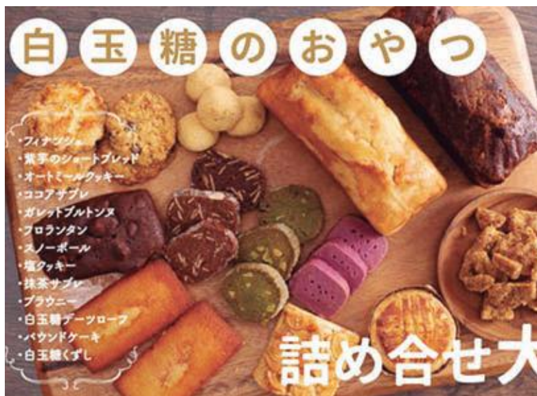
新たなふるさと納税返礼品

ら、当村に多くの寄付をいただいで大変ありがたい。職員の大変な頑張りの賜物だと思っている。本村の返礼品の品揃えが寄付者のニーズに合致した結果であると評価している。使用については、寄付者の意思を尊重し、村の懸案事項や活性化