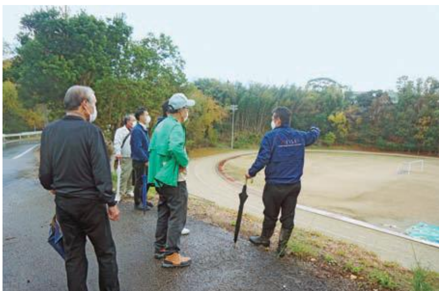
教育関連施設視察

老朽化も進む施設のある中、効率よく補修、改修を行い長く利用、活用するための課題を考えていかななくてはならないと感じました。