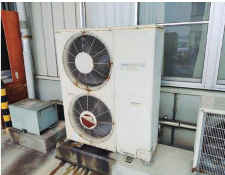
老朽化した集出荷場空調施設