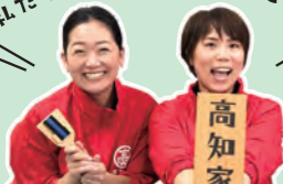
高知県移住コンシェルジュ

移住を考えるきっかけや目的はさまざま。 働き方の多様化が進み、より自由な生き方が選択できるよう なった今、好きな場所での暮らしを考えてみませんか?