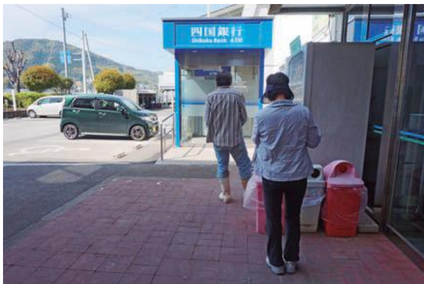
役場に設置されたATM

金融機関には、6機関に直接出向きATM設置を要望したが利用状況、費用対効果などの理由から今回は四国銀行のみとなっている。今後、他の金融機関から打診があれば協議の上対応していきたい。