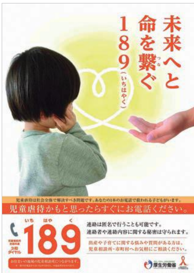
厚生労働省リーフレット