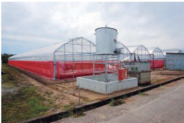
レンタルハウス（30年度建設）