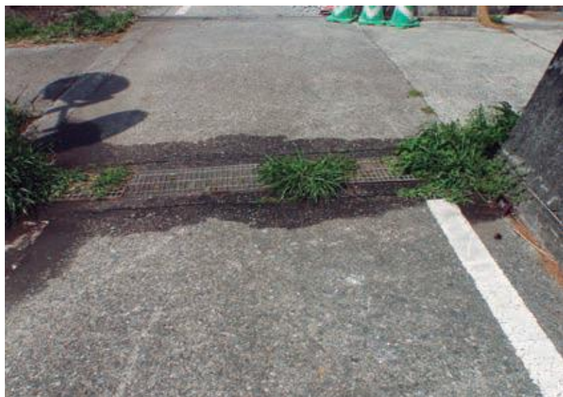
砂で埋まった排水路

意向に沿った形での運用を考え、ハード・ソフトを問わず将来に形として残るような事業や経費に有効に充てる。