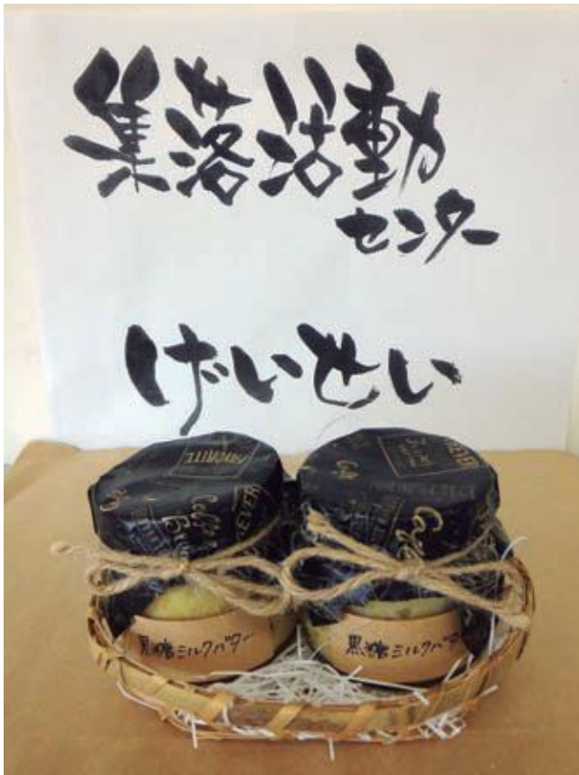
黒糖ミルクバター（試作品）