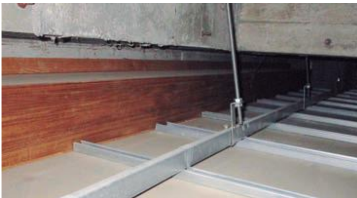
耐震改修予定の役場天井裏

庁舎、村民会館、生涯学習館、筒井美術館、老人福祉センターが予定されており、天井、壁、ロッカー、書棚などの耐震対策工事。