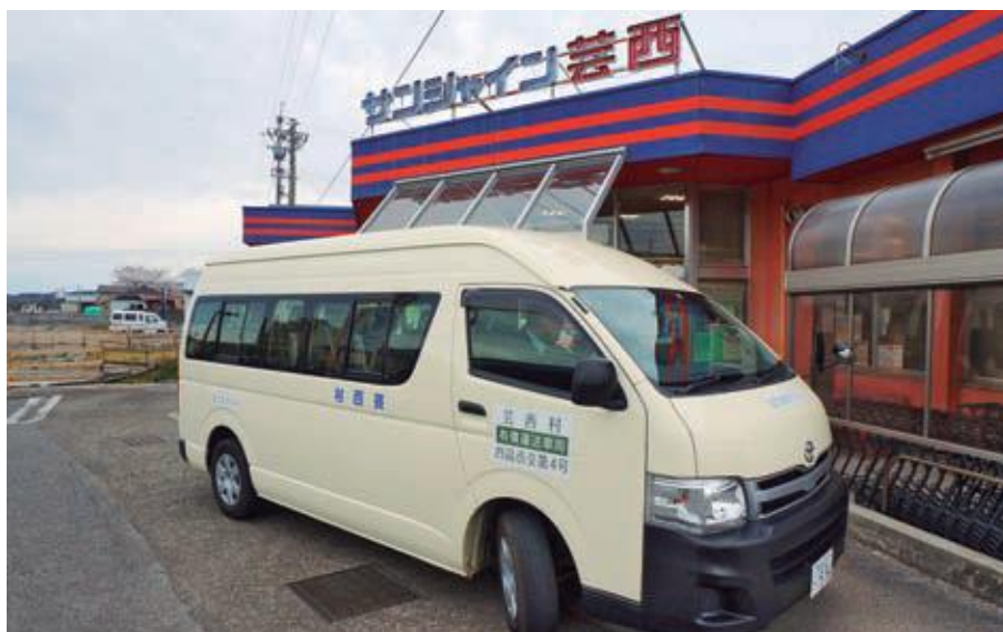
おでかけバス実証運行