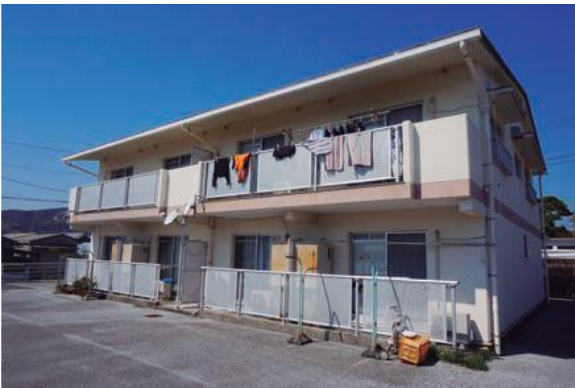
単身者用公営住宅（1階）

平成30年度から北芝団地建て替えのための費用を予算化している。現在北芝団地に居住している10世帯プラス移住者家族数軒分を考えている。高齢者の日常生活への地理的条件を考慮した場合、利便性に難はあるが、60歳以上であれば单身でも、夫婦であれば年齢に関係なく入居の申し込みはできる。